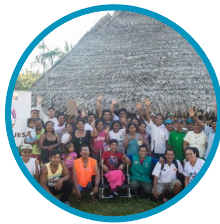
Mecanismos de Conservación de Bosques en Comunidades Nativas