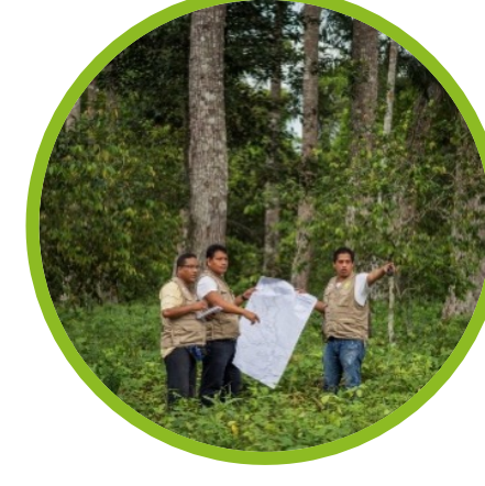
Gestión Efectiva de ACR