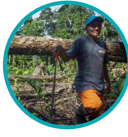
Manejo Forestal Comunitario