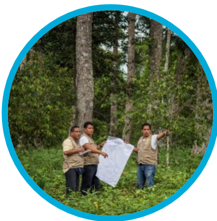
Asignación de Derechos en Tierras No Categorizadas de la Amazonía