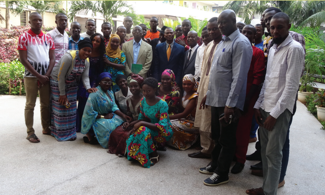
Formation des étudiants de l'IPR/IFRA et de l'Université de Segou

Nous avons formé 6 étudiant(e)s en license, 19 en maîtrise et 5 au doctorat . Ces scientifiques continuent de jouer un rôle important dans l'économie agricole du Mali, aux niveaux national et international dans les postes suivants : Chef Conseiller de la Sécurité Alimentaire de l'Union Africaine ; Ministre de l'Agriculture ; Ministre de l'Élevage et de la Pêche; Commissaire à la Sécurité Alimentaire ; Directeur Général de l'Office des Produits Agricoles du Mali (OPAM). Un grand nombre de ces scientifiques et analystes politiques se trouvent également à l'Institut d'Economie Rurale (IER), l'Institut Polytechnique Rural de Katibougou (IPR/IFRA), l'Observatoire du Marché Agricole (OMA), le Ministère de l'Agriculture, l'Institut International de l'Agriculture Tropicale (IITA), International Fertilizer Development Center (IFDC), United Nations International Development Organization (UNIDO) et le Comité Inter-états de Lutte contre la Sécheresse dans le Sahel (CILSS).