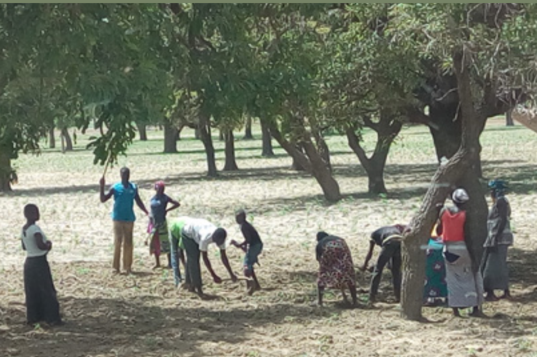
Cerclage du mil à Diabougou