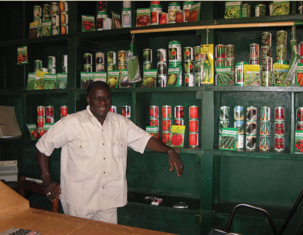
Vendeur d'intrants, Ségou

• Réforme des politiques et réglementations sur les intrants , en cours.