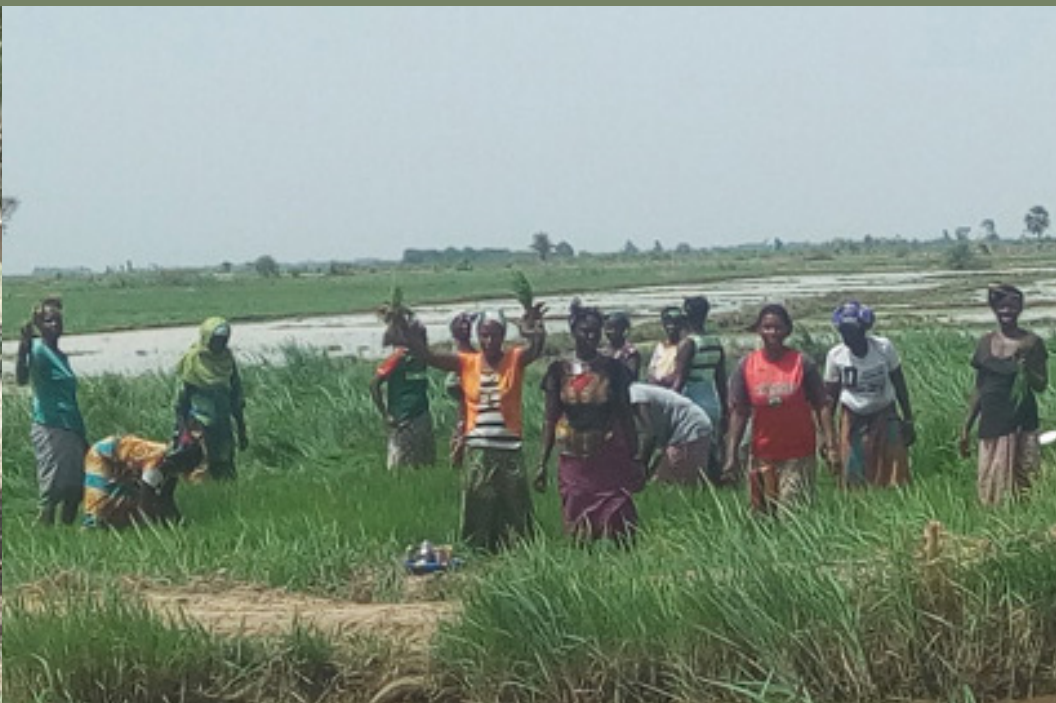
Repiquage du riz à Koulanbawèrè