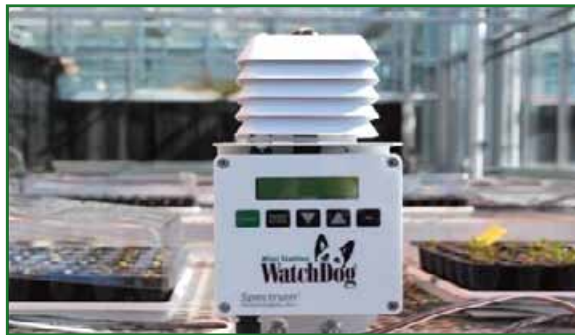
Figura 2. Una estación meteorológica WatchDog que contiene sensores de luz y proporciona automáticamente valores de DLI.

Esto es importante especialmente para los productores en las latitudes del norte donde la mayoría de cultivos son propagados desde diciembre hasta marzo y los valores naturales de DLI al aire libre son entre 5 a 30 mol·m -2 ·d -1 . Además, estos valores pueden disminuir entre un 40 y 70% gracias a la