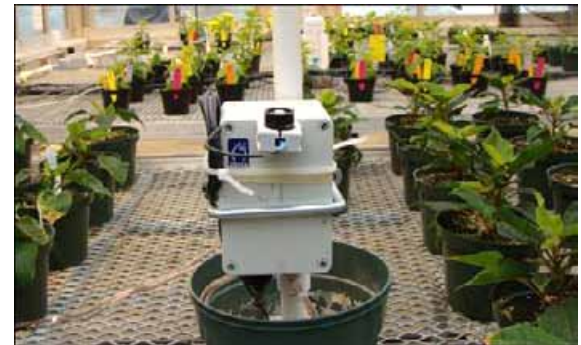
Figura 3. Un sensor de luz cuántica conectado a una computadora puede medir y registrar niveles de luz instantánea durante el día. La Tabla 1 muestra como estos valores pueden ser usados para calcular la DLI que reciben los cultivos.

tener los sensores nivelados y limpios para asegurar mediciones precisas.